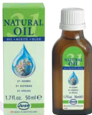
20 мл, 50мл